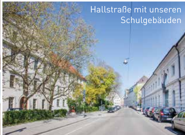
Hallstraße mit unseren Schulgebäuden