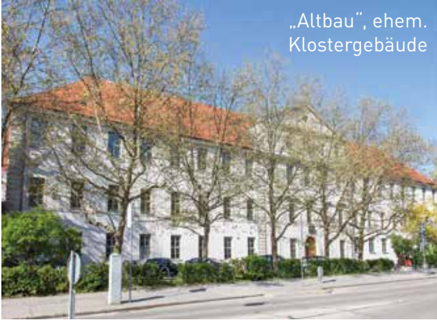
„Altbau“, ehem. Klostergebäude